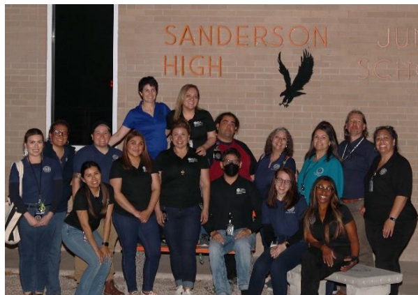
DSHS along with its partners provided resources to Sanderson, TX residents.

El evento fue muy concurrido y bien recibido, por lo que hay planes en marcha para celebrarlo anualmente.