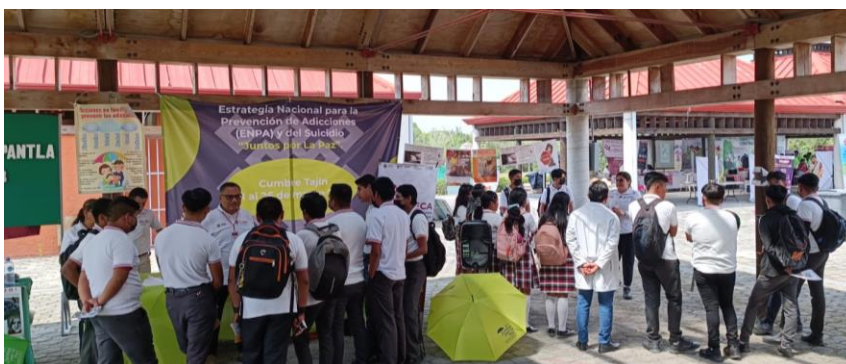
Community activities of Clubs for Peace, carried out within the framework of the National Strategy for the Prevention of Addictions

Desde la ENPA seguiremos fomentando el fortalecimiento de factores protectores y la disminución de factores de riesgo, así como la prevención y la reducción del consumo de sustancias psicoactivas , prioritariamente en las infancias y juventudes, con la participación protagónica de la comunidad.